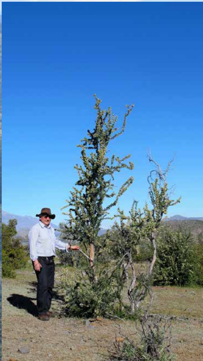
Tralhuén ( Trevoa quinquenervia )