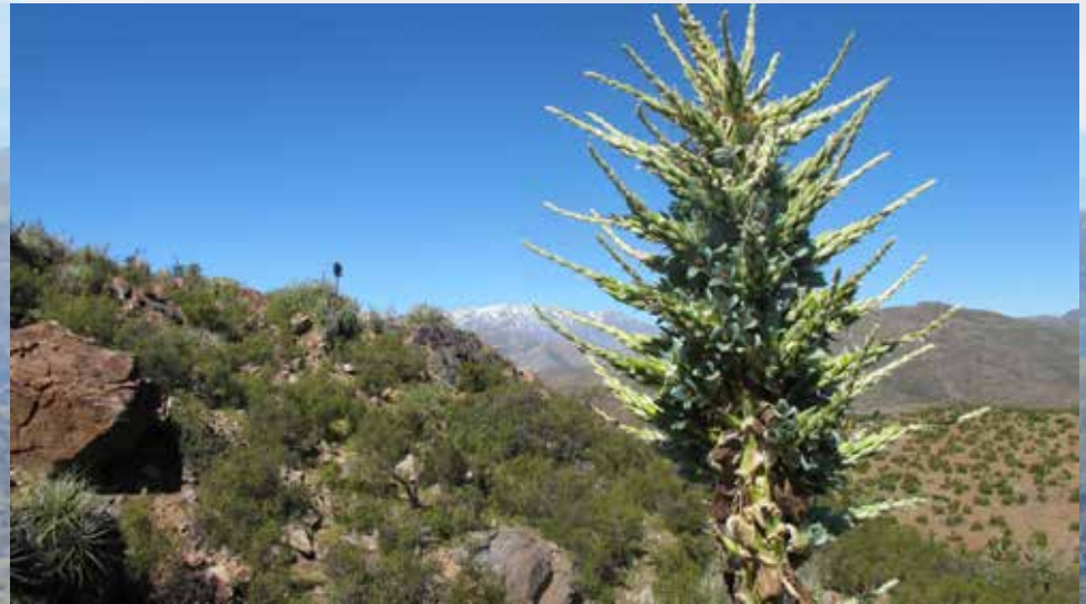
Puya o Chagual ( Puya berteroniana )