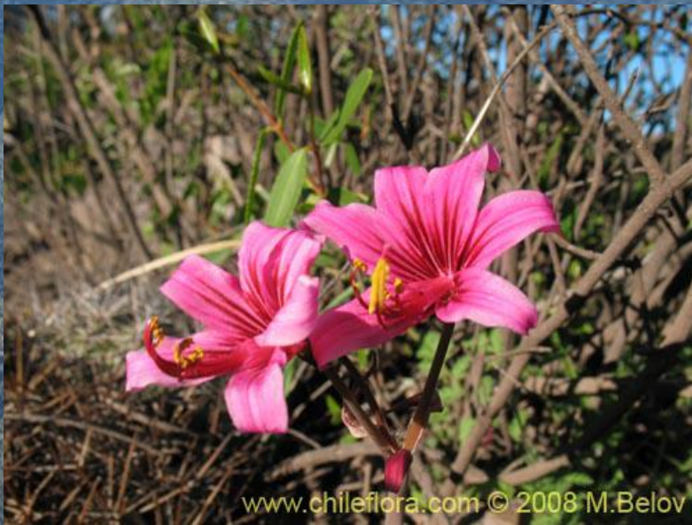
Macaya ( Placea amoena )