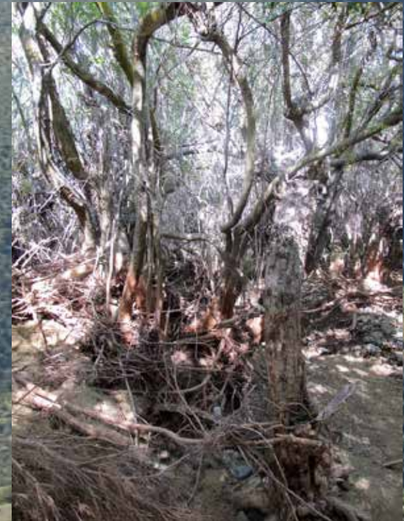
Arrayán ( Luma chequen )