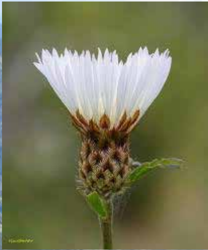
Flor del minero ( Centaurea chilensis )