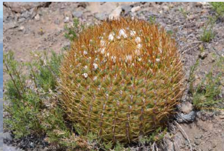
Sandillón, Asiento de la suegra ( Eriosyce aurata )